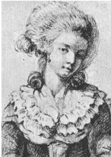
Porträt der echten Madame Royale während ihrer Gefangenschaft

des Vatikans und des französischen Außenministeriums, wo das Testament hinterlegt worden sein soll, ergaben, dass ein derartiges Schriftstück in den Beständen nicht vorhanden war. Bis zum heutigen Tag konnte es nicht gefunden werden und so ist unbekannt, ob es tatsächlich existierte und was dessen Inhalt gewesen sein soll.