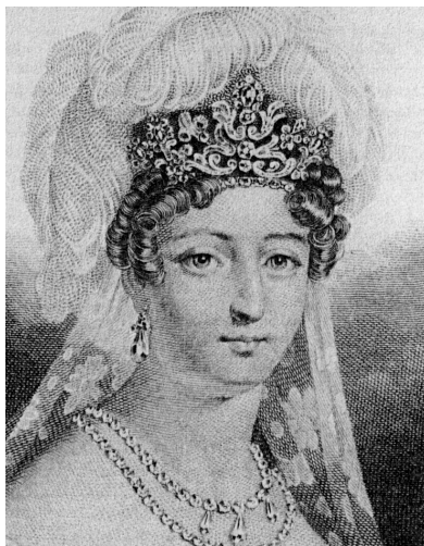
Porträt der Herzogin von Angoulême