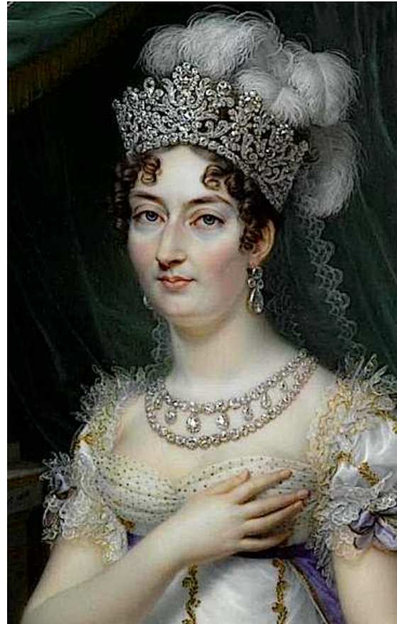
Herzogin von Angoulême

von Anzeigen, Hängen und Erschießen die Rede war. Die Herzogin stellte eigenhändig die Listen der Personen zusammen, die zu verhaften oder öffentlich zu ächten waren. Allein im ersten Quartal des Jahres 1816 kam es zu 70.000 Verhaftungen. Hohe Militäranghörige, die zu Napoleon übergelaufen waren, wurden zum Tode verurteilt, ins Gefängnis geworfen oder degradiert.